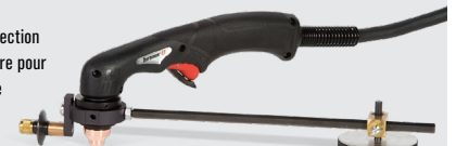
Guides de coupage circulaire

En savoir plus sur www.hypertherm.com/powermax33XP